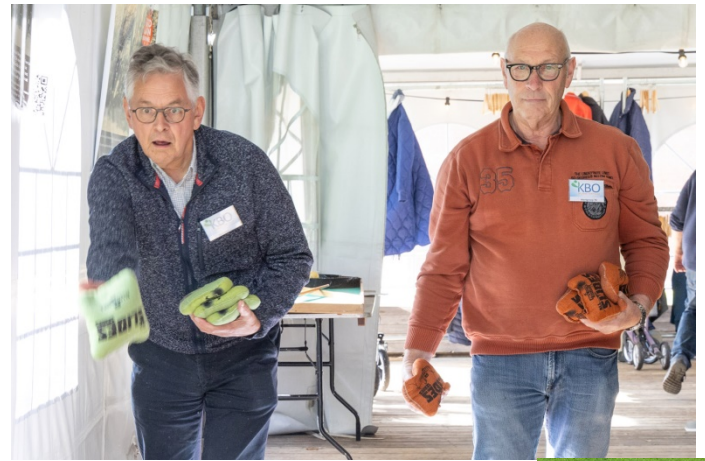
Het Cornhole spel, waar met maïs - gevulde zakjes in een gat in een houten plank gegooid moeten worden.