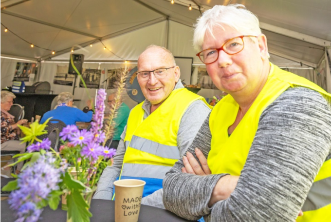
Onze EHBO-ers, gelukkig niet nodig bij de spelletjes