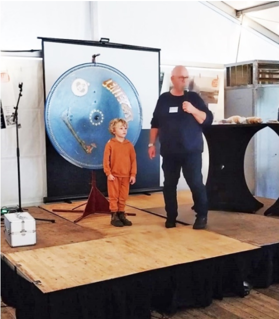
Tot slot was er een Rad van Fortuin .

Bij binnenkomst werd een lotje met een getal uitgedeeld, zodat om ca. 16.00 uur het rad kon worden gedraaid.